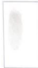
Impresión dactilar (I.D.)