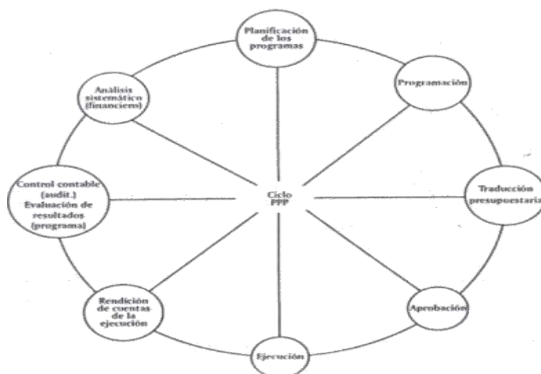
Figura 1. El ciclo PPP.