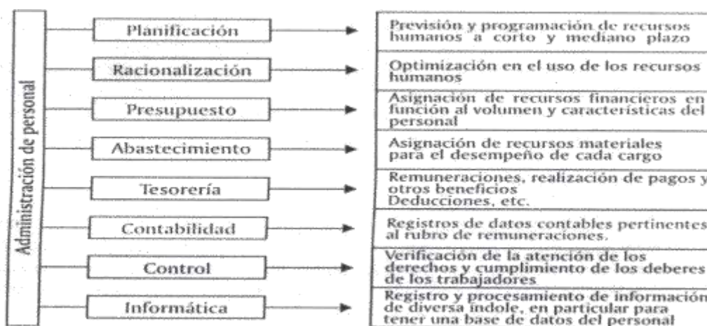
Tabla 4. Administración del personal.